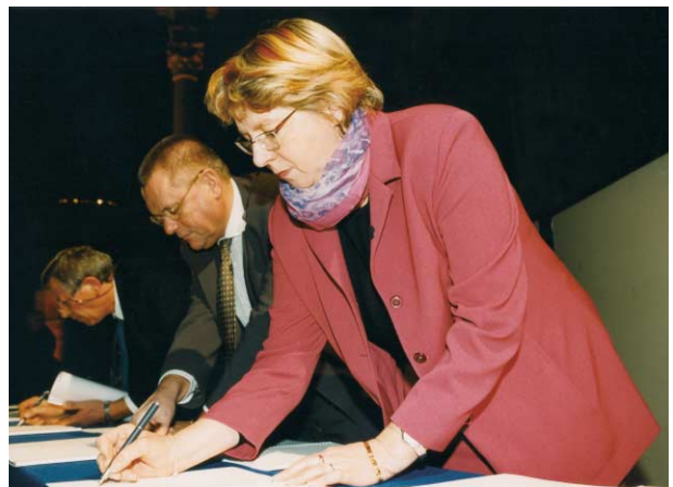
1 • Signature de la charte des villes fortes en décembre 2003

Signée en décembre 2003, cette charte représente l'engagement de placer le patrimoine au cœur des problématiques d'aménagement et de développer les moyens d'une large participation citoyenne à leur évolution.